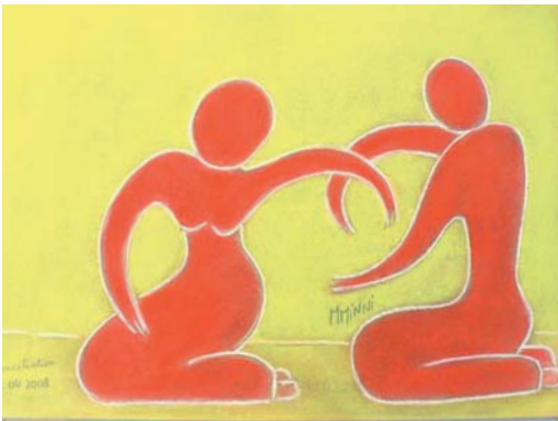
Réconciliation, pastel, 2008 - © Monique Minni